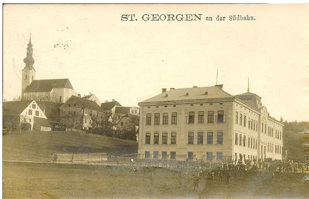
Slika 1: Otvoritev matične šole, 1909

Najstarejša stavba zavoda je del podružnične šole, ki je bil zgrajen leta 1907, na matični šoli pa je njen najstarejši del secesijska stavba iz leta 1909.